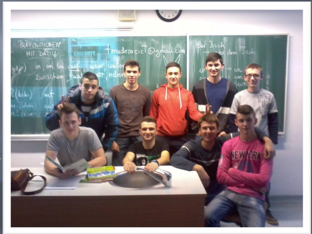
das sind wir: die Schüler der 4b Klasse